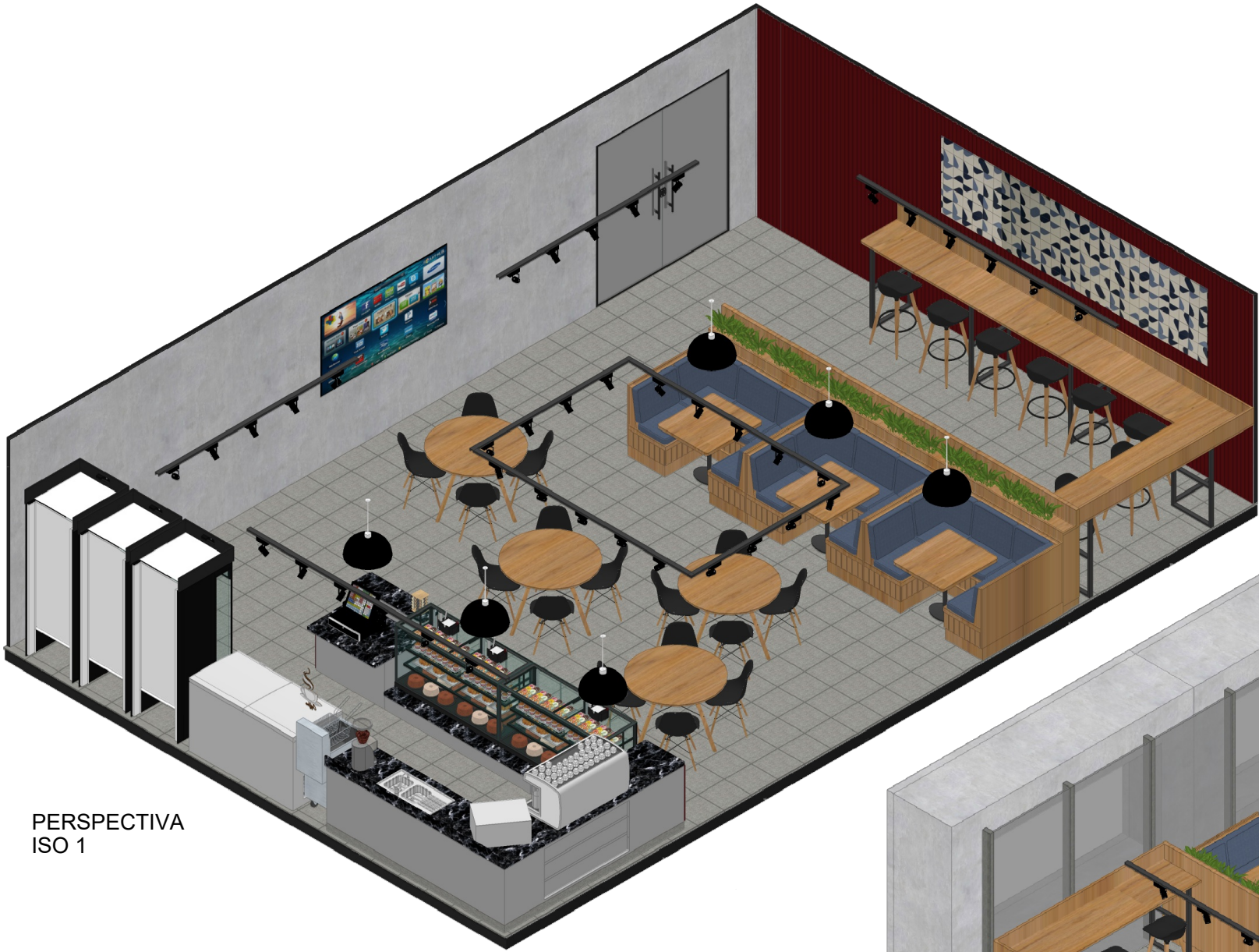
PERSPECTIVA ISO 1