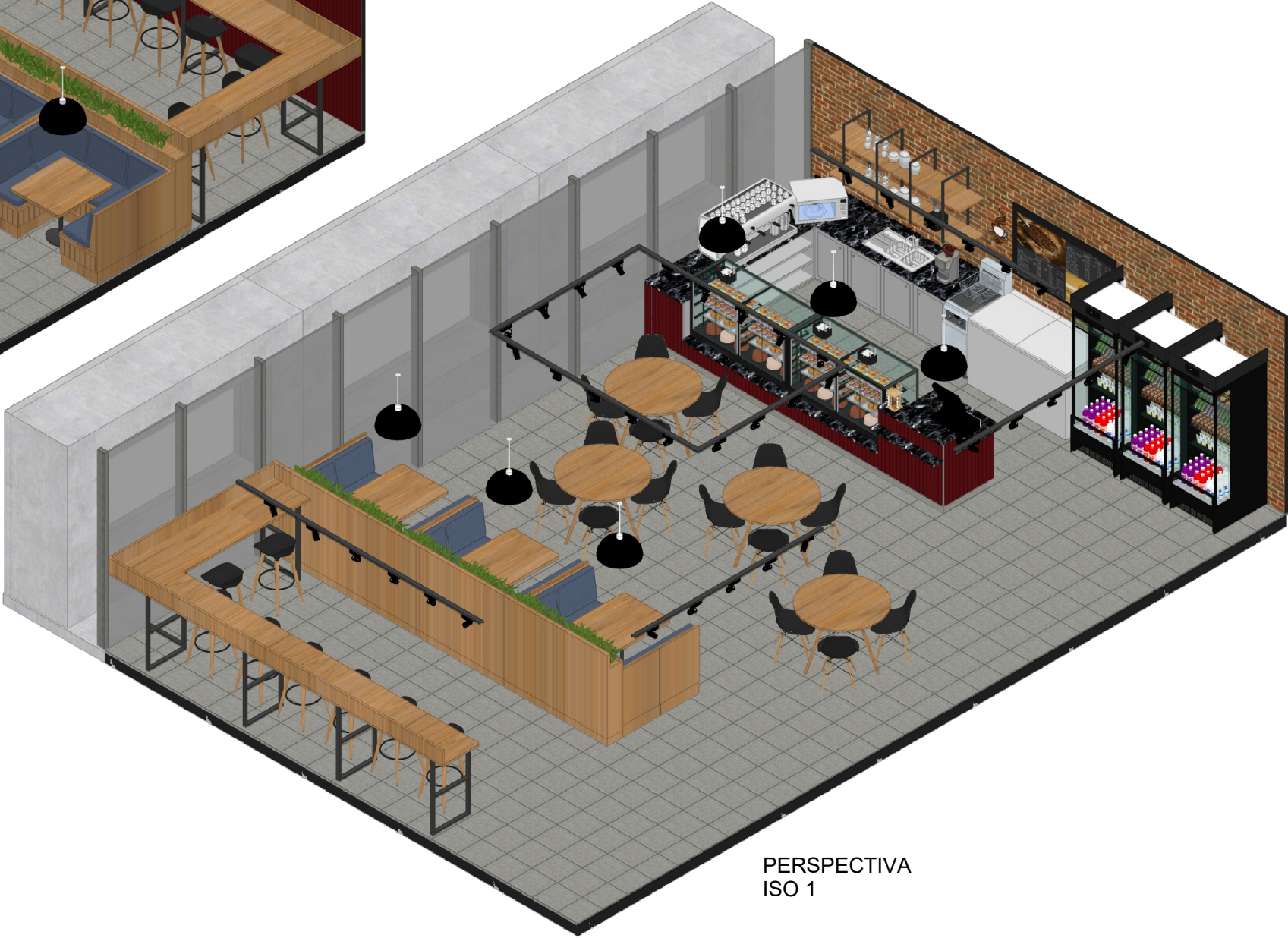
PERSPECTIVA ISO 1